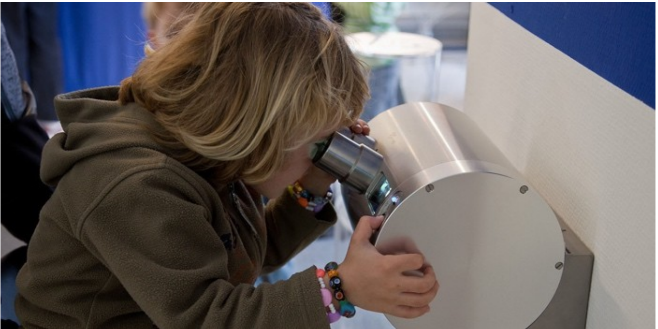
Ein 3-D-Gucker zeigt historische Fotos der Bodenseelandschaft.