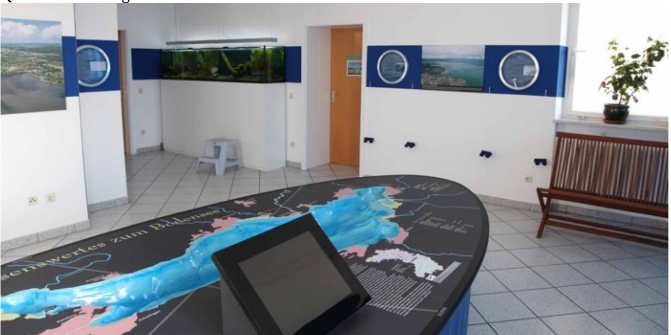
3D-Bodenseemodell im Foyer